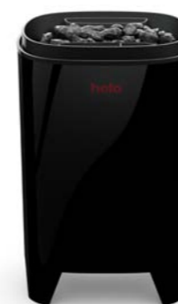
Piec w wersji podłogowej*