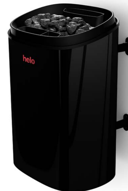
Piec w wersji naściennej

Czasami wolisz tradycyjne ciepło. Innym razem delikatne oczyszczanie dzięki ultra miękkiej parze. Fonda Duo daje Ci luksus wyboru z zastosowaniem tego samego, kompaktowego, przyciągającego oko pieca do sauny. Dodatkowych wrażeń mogą Ci dostarczyć olejki eteryczne, posiadające potwierdzone walory zdrowotne. Po prostu dodaj kilka kropli naturalnych olejków eterycznych Helo do pojemnika w piecu.