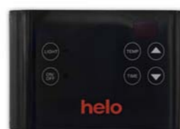
Panel sterujący EC50