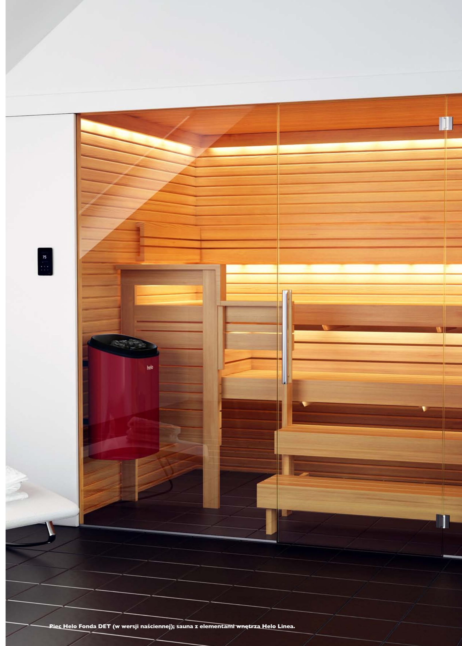
Piec Helo Fonda DET (w wersji naściennej); sauna z elementami wnętrza Helo Linea.